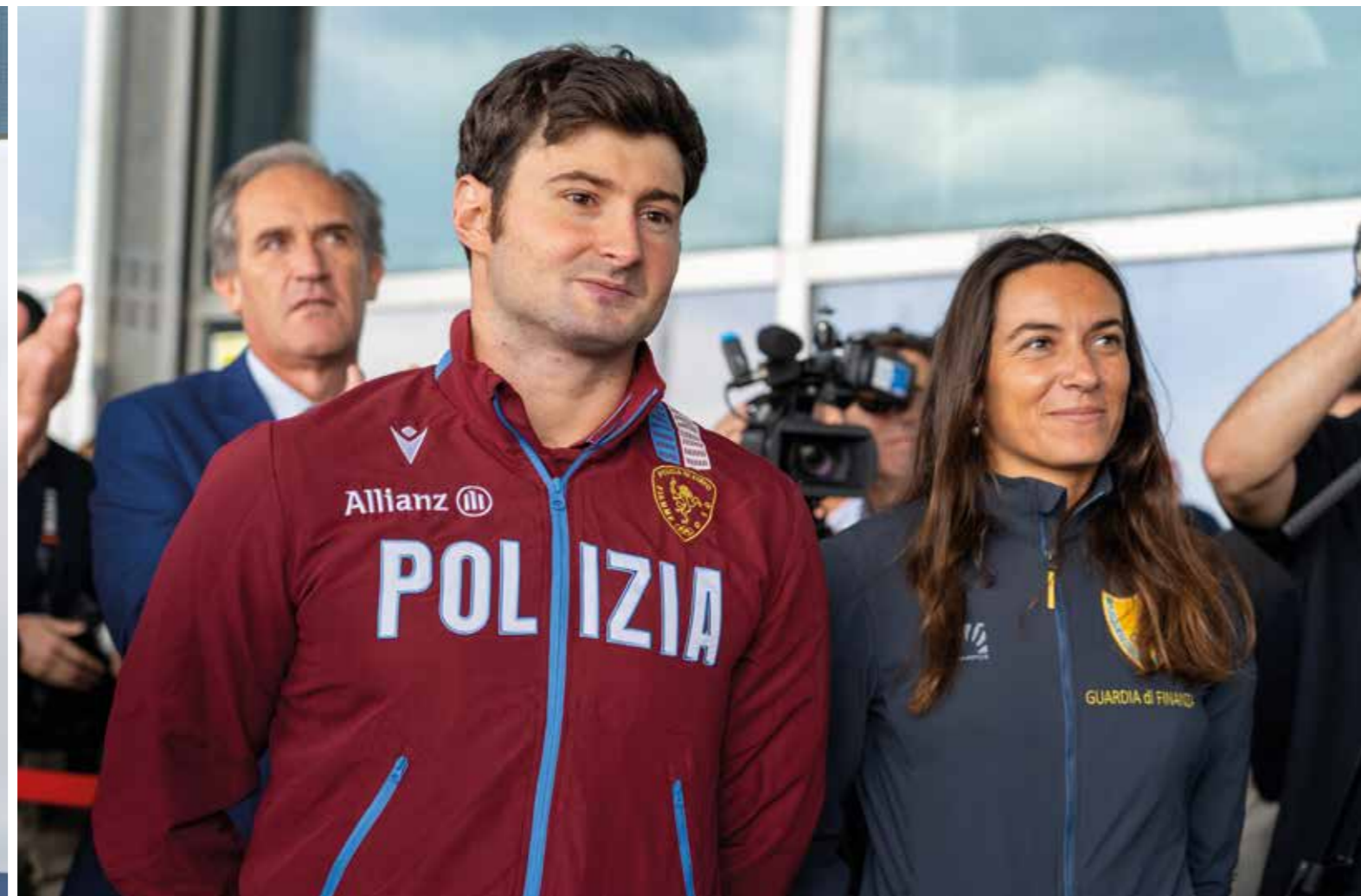
FRANCESCO BOCCIARDO NUOTO MEDAGLIA D'ORO 200 METRI PARALIMPIADI PARIGI 2024 FRANCESCO BOCCIARDO 200 METRES SWIMMING GOLD MEDALLIST AT THE 2024 PARIS PARALYMPICS