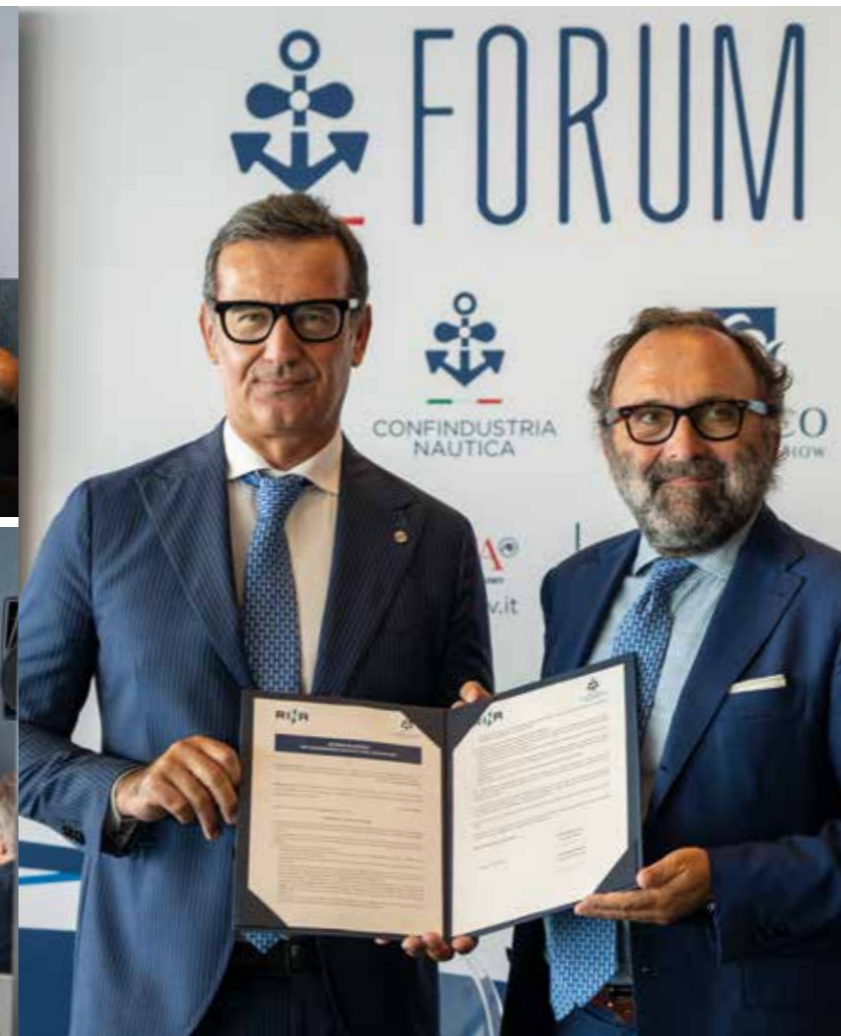
CERTIFICAZIONE ISO 20121 PER LA PROGETTAZIONE SOSTENIBILE DELL'EVENTO SALONE NAUTICO INTERNAZIONALE DI GENOVA (ente certificatore RINA) ISO 20121 CERTIFICATION FOR THE SUSTAINABLE DESIGN OF THE GENOA INTERNATIONAL BOAT SHOW (certified by RINA)