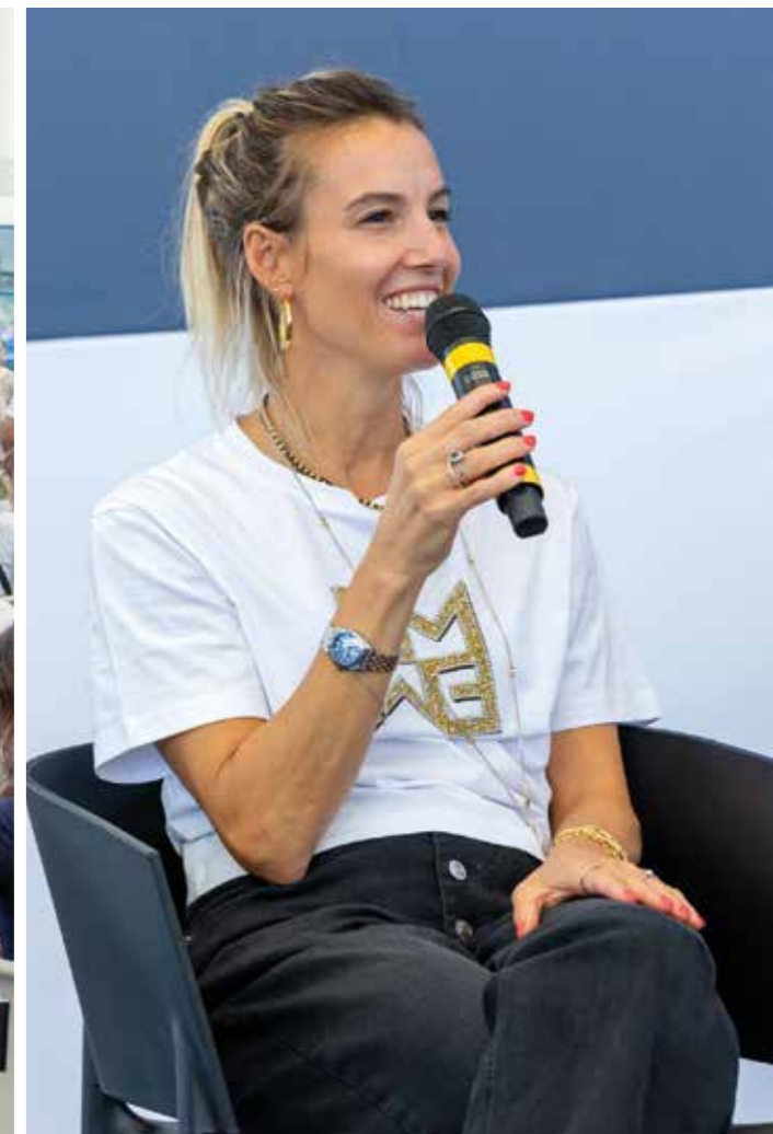
TANIA CAGNOTTO TUFFI MEDAGLIA D'ARGENTO E DI BRONZO OLIMPIADI RIO DE JANEIRO 2016 4 TANIA CAGNOTTO DIVING SILVER AND BRONZE MEDALLIST IN RIO DE JANEIRO 2016