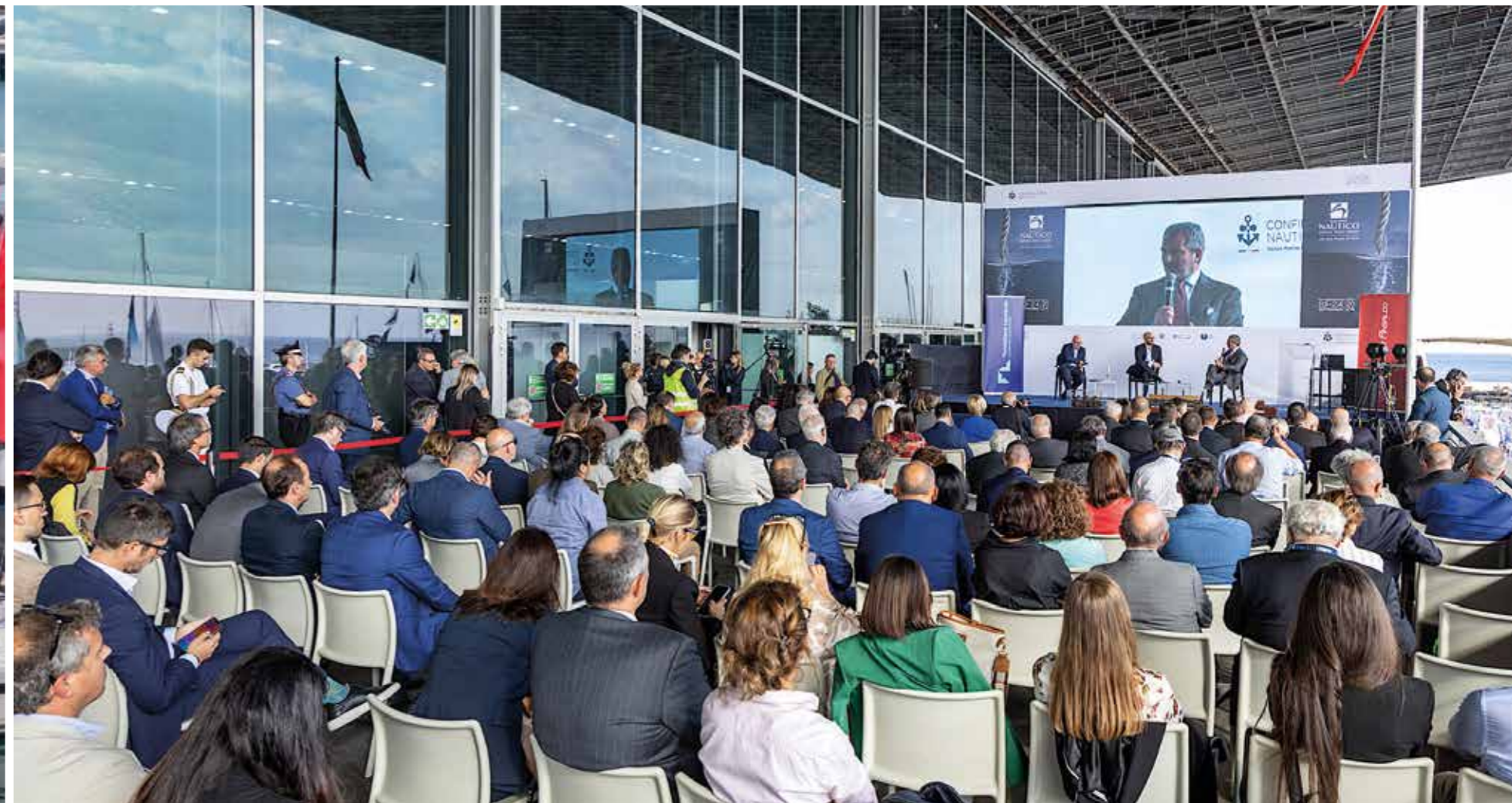
MARCONI E L'INVENZIONE DELL'INDUSTRIA TECNOLOGICA, Fondazione Leonardo e Fondazione Ansaldo MARCONI AND THE INVENTION OF THE TECH INDUSTRY, Leonardo and Ansaldo Foundations