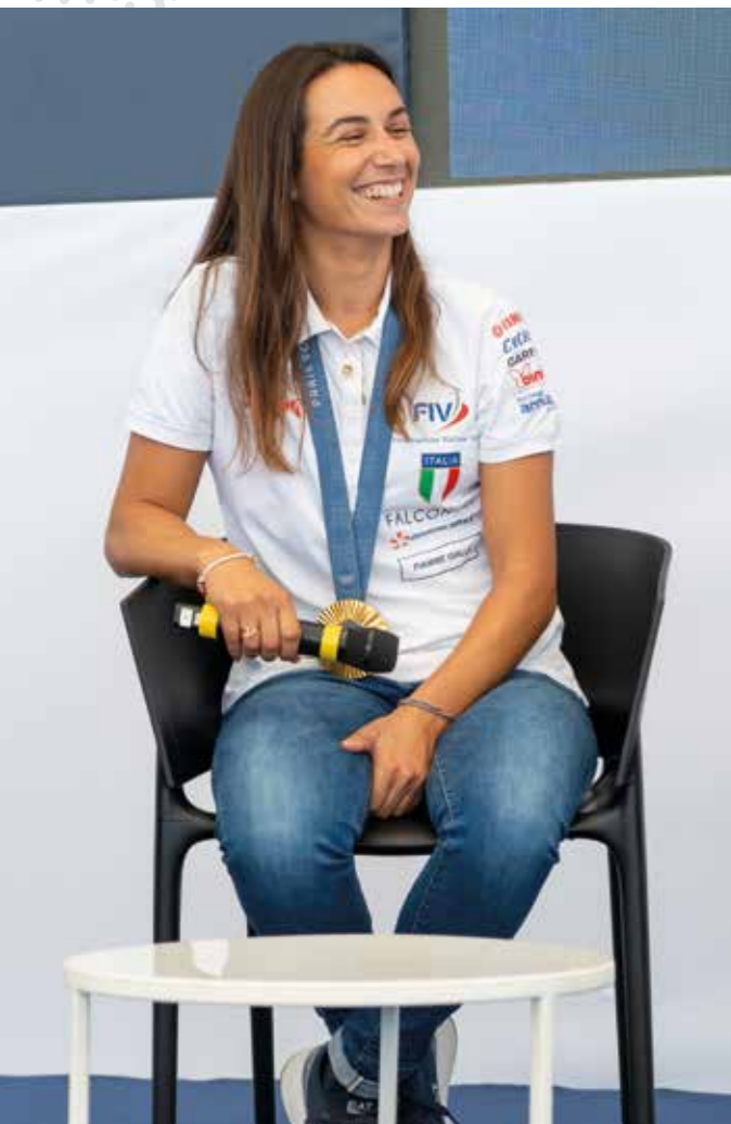
MARTA MAGGETTI VELA MEDAGLIA D'ORO CLASSE WINDSURF IQ FOIL PARIGI 2024 MARTA MAGGETTI SAILING GOLD MEDALLIST IN THE WINDSURFING CLASS IQ FOIL IN PARIS 2024