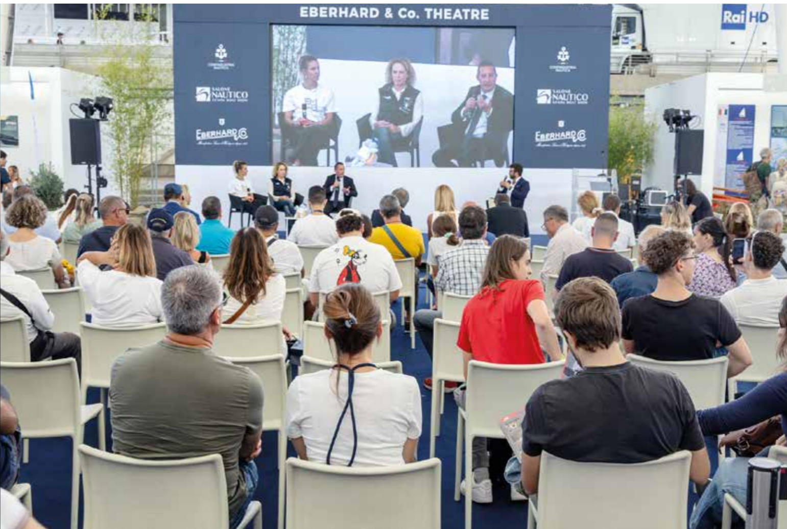
ALESSANDRA SENSINI CAMPIONESSA OLIMPICA WINDSURF DUE BRONZI ATLANTA 1996 E ATENE 2004, UN ORO SYDNEY 2000, UN ARGENTO PECHINO 2008 ALESSANDRA SENSINI OLYMPIC WINDSURFING CHAMPION WITH TWO BRONZE MEDALS IN ATLANTA 1996 AND ATHENS 2004, GOLD IN SYDNEY 2000, AND SILVER IN BEIJING 2008