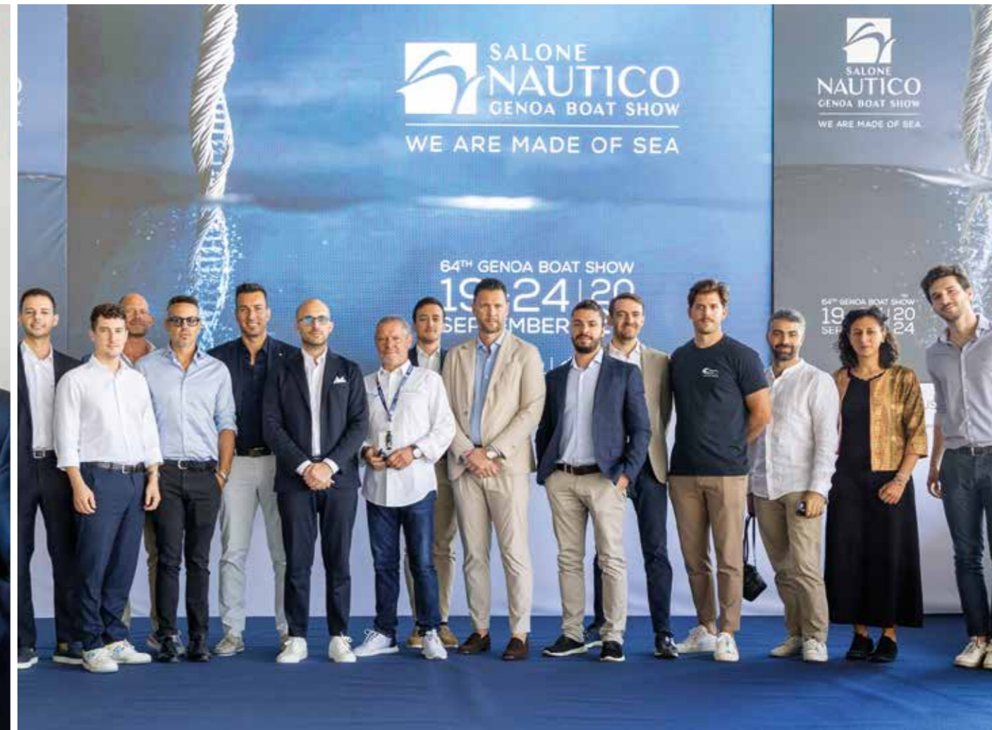
START-UP INNOVATIVE DELLA NAUTICA, Confindustria Nautica THE YACHTING INDUSTRY'S INNOVATIVE START-UPS, Italian Marine Industry Association