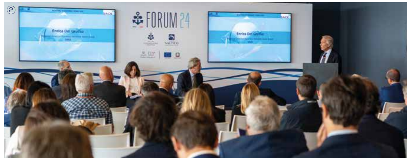
① NAUTICA E FISCO, Confindustria Nautica / YACHTING TAX AND CUSTOMS, Italian Marine Industry Association ② BOATING ECONOMIC FORECAST, Italian Marine Industry Association